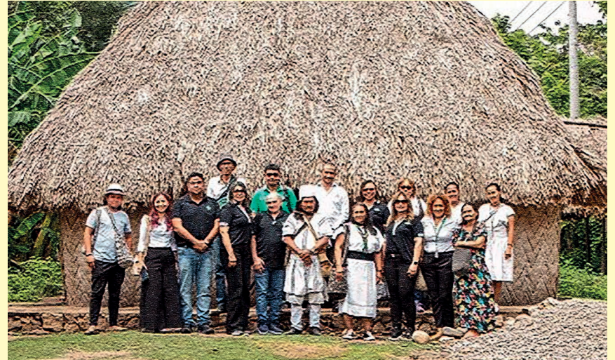
imagen-, Corresponsalías populares Guajira