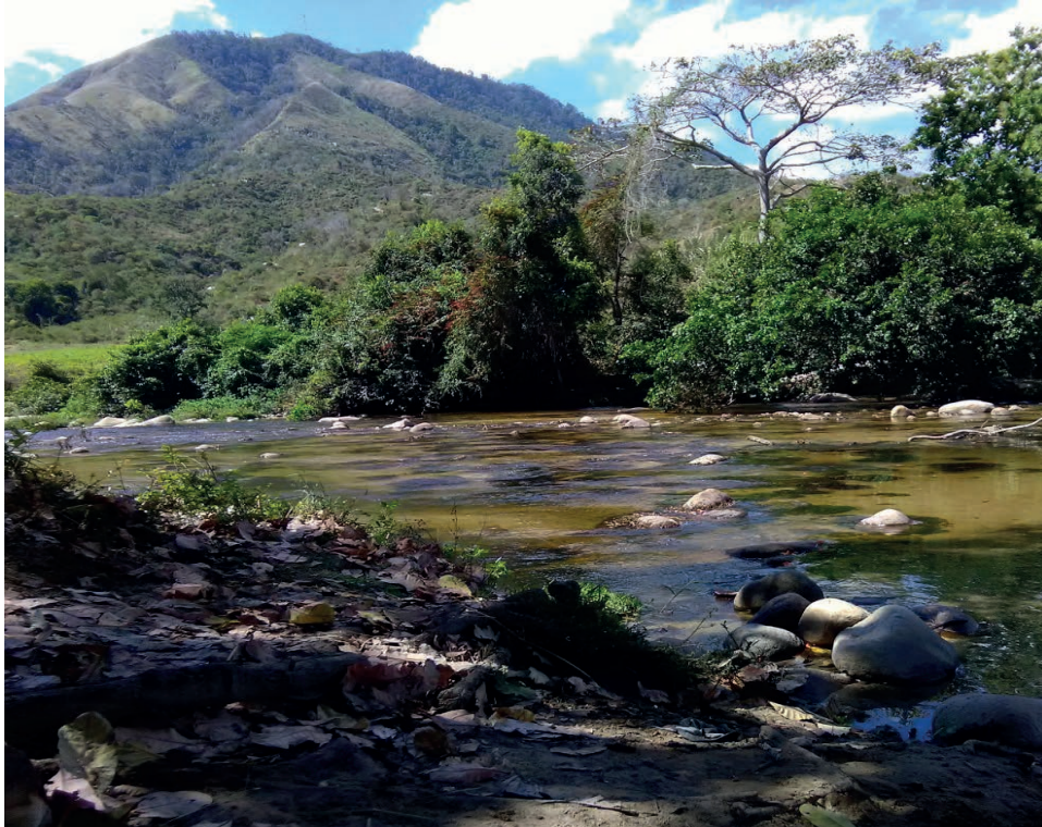
Imagen: Corresponsalías populares