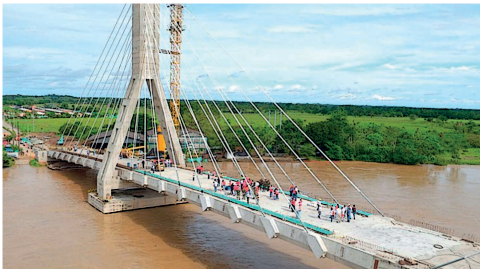
Imagen: Puerto Rico - Meta

3. Los procesos sociales hicieron un llamado a la gobernación del Meta que se unan a trabajar de manera articulada entre alcaldías y campesinos para lograr cambios estructurales que impulsen el desarrollo y se pueda ejecutar el plan de desarrollo de la ZRC