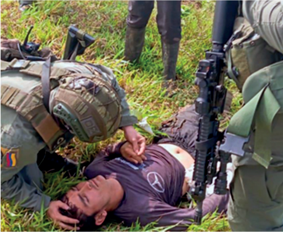
Trabajador campesino herido en operación del Ejército y policía en Guaviare.

Por: Redacción /Corresponsalías Populares Oriente