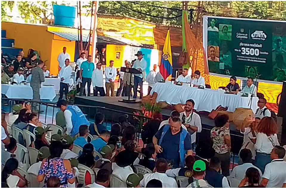
Imagen: Corresponsalías Populares Guaviare

Por: Luis Eduardo Betancurt / Corresponsalías Populares Guaviare