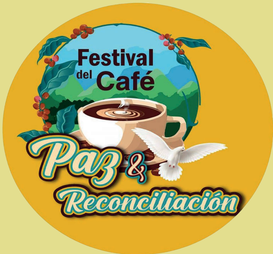
Logo oficial del Festival