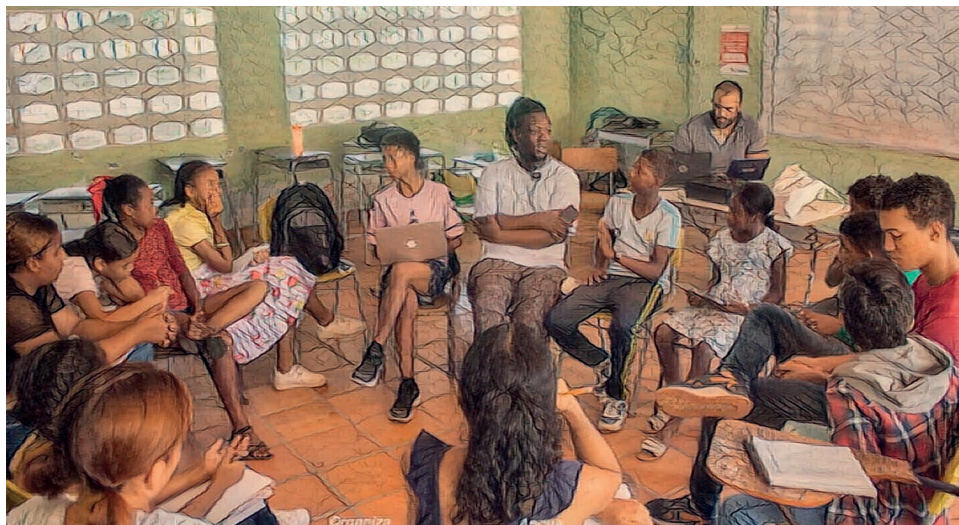
imagen-, Corresponsalías populares Guajira

Por: Edivilia Uriana – RNC / Mayabangloma